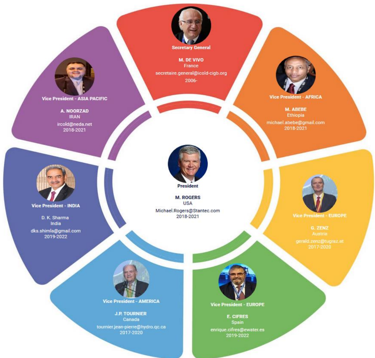
Prezident, viceprezidenti a sekretár ICOLD